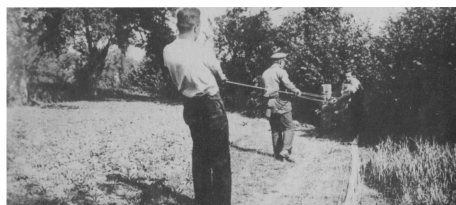
Seilerarbeiten um 1932