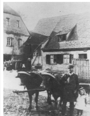
Mühlgasse um 1925 Der Steigerwald 1988/4, S. 639