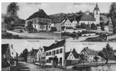
Alte Ansichtskarte von Burghaslach

Beide Mühlen sorgten einmal für das „tägliche Brot“ in Burghaslach. Die Neue Mühle war bis 1956 in Betrieb. (Eine dort 1777 errichtete Windmühle fiel kurz danach bei einem Sturm wieder ein.) Die Höhn's Mühle war von 1785 bis 1961 als Getreidemühle in Betrieb. Die mit ihr verbundene Säge wurde darüber hinaus bei Bedarf weiter genutzt.