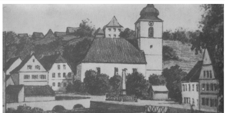
Kirchplatz Burghaslach (um 1910)