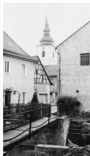
Der Steigerwald 1981/3, S. 71