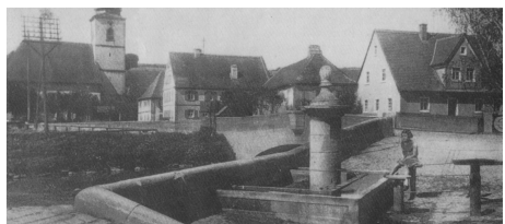
Der alte Röhrenbrunnen am Marktplatz