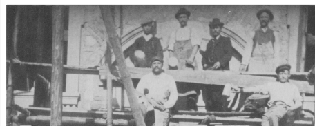
Kirchenrenovierung 1903 Der Steigerwald 1988/4