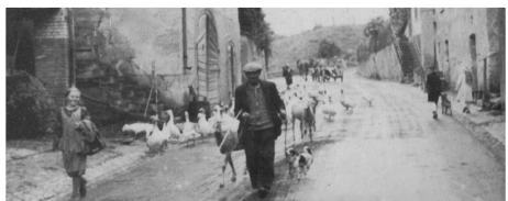
Der Gänshirt' (um 1950)