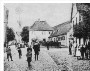
Bäckergasse 1909 Der Steigerwald 1988/1, S. 354