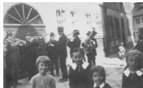
Musikkapelle Breitenlohe in den 1930iger Jahren Der Steigerwald 1988/4, S. 639