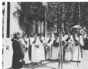
Einweihung der Turnhalle 1898

Der Steigerwald 1988/1, S. 355 & 2004/1, S. 153