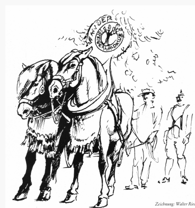
Zeichnung: Walter Röck