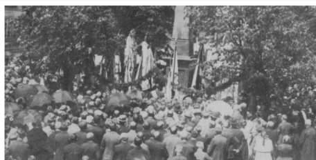
Denkmaleinweihung am 28.5.1922